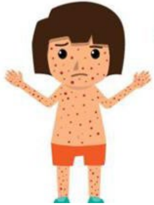
خارښت لرونکي دانې