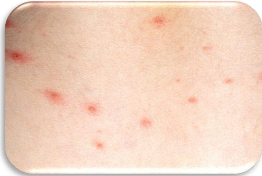
د چيچک ناروغي په سرو داغونو سره پيل کيږي.

https://www2.hse.ie/conditions/chickenpox/