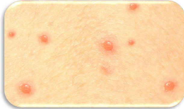
داغونه د مايعاتو څخه ډکيږي او کيدای شي وچوي.